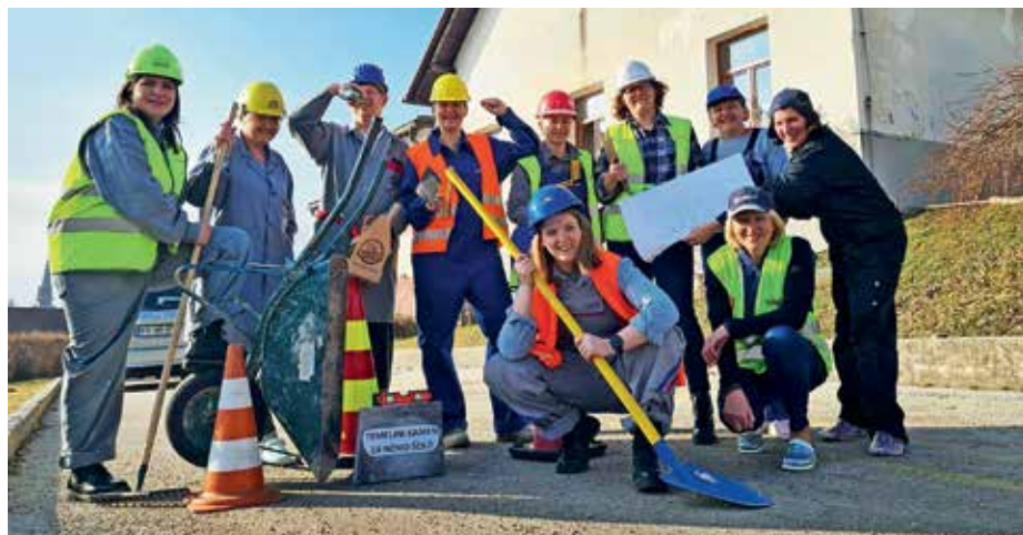
Učitelji in drugi delavci šole na pustni torek

štirideset let, je bilo povod, da so se učiteljice in učitelji ter sodelavci odločili, da bodo lopate in krampe vzeli v roke sami. Škoda le, ker je bil pustni torek in so že naslednji dan ponovno poprijeli za delo v šoli, ki ga na srečo staršev in otrok kljub zelo slabim razmeram srčno in z velikim veseljem opravljajo. Hvala jim za trud in tudi za to dobro pustno idejo. V Javorjah pa upajo, da bo temelji kamen v bližnji prihodnosti le našel svoje mesto sredi vasi.