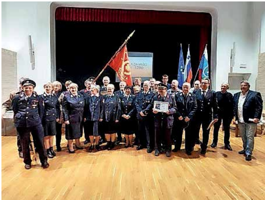
Gasilke in gasilci še zadnjič zbrani kot člani PIGD Jelovica

aktivno udeleževalo društvenih in meddruštvenih vaj, tekmovanj, pogašenih je bilo kar nekaj požarov v obratih Gorenja vas, Stari dvor in Preddvor. Članstvo se je začelo starati in upadati, saj niso zaposlovali novih delavcev, manjši je bil interes za gasilsko dejavnost v podjetju. Po 60 letih je društvo ostalo brez gasilskega doma in orodnega gasilskega vozila in je bilo še edino PIGD na Škofjeloškem. Leta 2012 je prenehala delovati gasilska služba in kot še edini poklicni gasilec je ostal Andrej Premru, ki je bil premeščen v proizvodnjo Gorenja vas z namenom, da bi še naprej opravljal gasilska dela, po potrebi izvajal gasilsko stražo ter pregled gasilnikov po vseh obratih Jelovice. Leto kasneje jih je pod svoje okrilje vzelo GPO Gorenja vas - Poljane. Ob zledolomu so bili gasilci aktivirani za pomoč krajanom. Konec leta 2017 je društvo na upravo Jelovice naslovilo pismo z željo po zaključku delovanja, a so prejeli odgovor, naj še naprej delujejo po svojih zmožnostih. Odločili so se, da bodo delovali do leta 2021, ko bo društvo dopolnilo 70 let. Delovali so vse do letošnjega februarja,