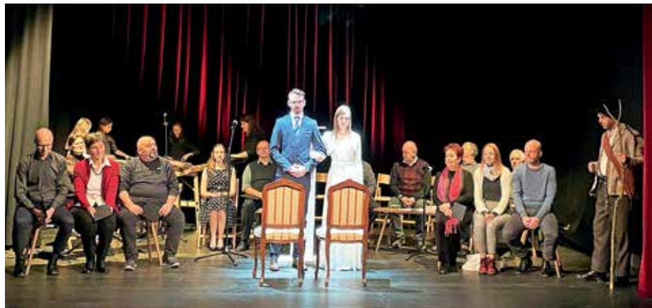
Ljubezen po Tavčarju na odru Sokolskega doma ob kulturnem prazniku

čarjem, saj je za ohranjanje spomina na Tavčarja in njegovo delo naredila največ, »veliko več kot država in visoka kultura«. »Leta 1951 je Poljane in Visoko obiskala močna državna delegacija. Šele po 72 letih bodo državni uradniki spet prihajali v Poljansko dolino ob obletnici njegove smrti. Visoka kultura je res vključila Tavčarja v šolske programe, v film, muzikal ter novo dramatisacijo Visoške kronike, vmes so ljubiteljski ustvarjalci po Sloveniji in v Poljanski dolini uprizarjali njegova dela, v ospredju so bila prizadevanja poljanskega kulturnega društva, pod čigar okriljem je bilo izdanih nekaj del z besedili v poljanskem narečju, narejeni dramatisaciji Visoške kronike in Šarevčeve slive, večkrat organizirani Tavčarjevi dnevi, okrogle mize itd. V Poljanah so že najmanj 75 let prisotna dejanja, ki so vtisnila Tavčarja v kulturno zavest lokalnega prebivalstva in širše,« je poudaril in obljubil, da si bodo s predstavniki drugih