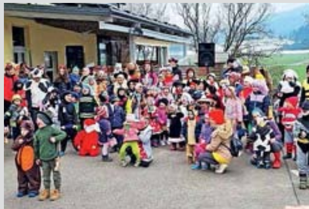
Veselo pustno rajanje

Na pustno soboto so se male in velike maškare zbrale na parkirišču v Blatih in se v sprevedu ob spremljavi harmonike podale na rajanje pred Zrajdnca bar. Tam so se zabavale in plesale skupaj s Sneguljčičo in palčkom. Šeme, bilo jih