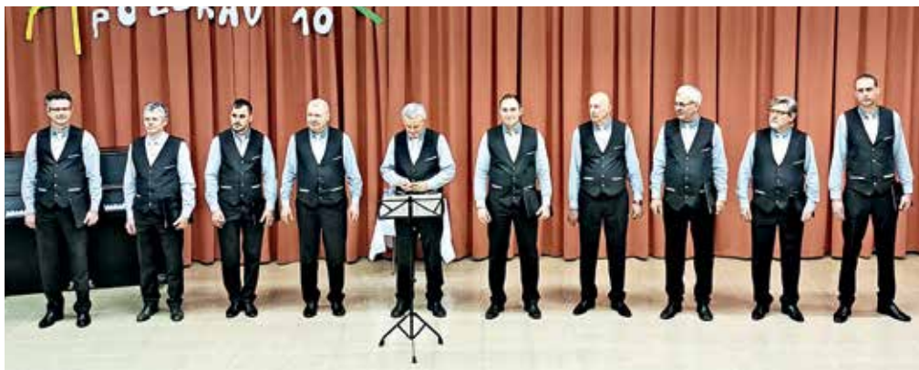
Moška vokalna skupina Pozdrav na koncertu ob desetletnici delovanja