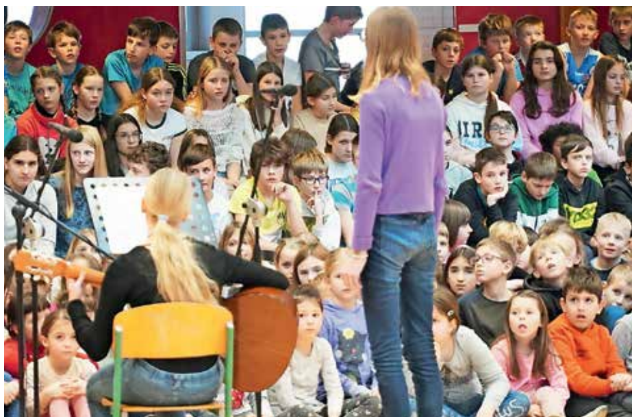
Prireditev ob kulturnem prazniku

Učenci šestih razredov so pri naravoslovju v okviru projektne naloge izdelali modele rastlinskih celic. Pri tem so uporabili znanje, ki so ga pridobili pri pouku naravoslovja. Na modelih so prikazali znanje o zgradbi rastlinske celice in inovativnost pri izbiri materialov. V prvem nadstropju šolskega hodnika je pripravljena razstava modelov, ki bo na ogled še nekaj časa.