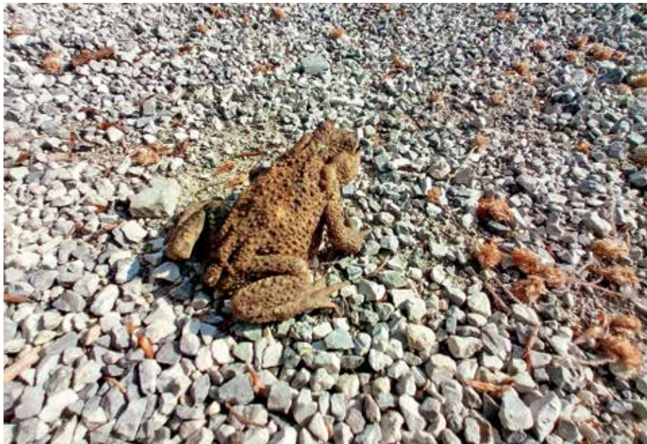
Pazimo na dvoživke na cestah in drugih javnih površinah.

Letošnje zimske temperature so bile v januarju tako visoke, da smo lahko celo pozimi srečevali močerade. Prve, po navadi že v februarju, se na selitveno pot do vode odpravijo rjave žabe in krastače, nato še pupki, zelene žabe in zelene rege. Verjetno je vsem znano, da dvoživke živijo v dveh življenjskih prostorih, v vodi in na kopnem. Vendar so na vodo vezane predvsem v času razvoja iz jajc v odrasle živali. Odrasli osebki večine vrst dvoživk namreč sploh ne živijo v vodi, temveč se tam zberejo le v času razmnoževanja. V občini Gorenja vas - Poljane je nekaj vodnih teles, ki so mrestišča za dvoživke, na primer toplotni izvir v dolini Kopačnice, pritoki Poljanske Sore, jarki potoka Mihevk in mlaka v Žabji vasi. Žabja vas nima takšnega imena brez razloga. Sredi vasi je mlaka, v katero vsako leto pride odlagati jajca več kot sto osebkov sekulj. Sekulje spadajo med rjave žabe, ki imajo hrbet rjave, rdečkaste do olivno zelene barve z vzorcem temnejših lis, trebuh je svetlejše barve. Čez oči imajo temno rjavo masko. Od podobne rosnice