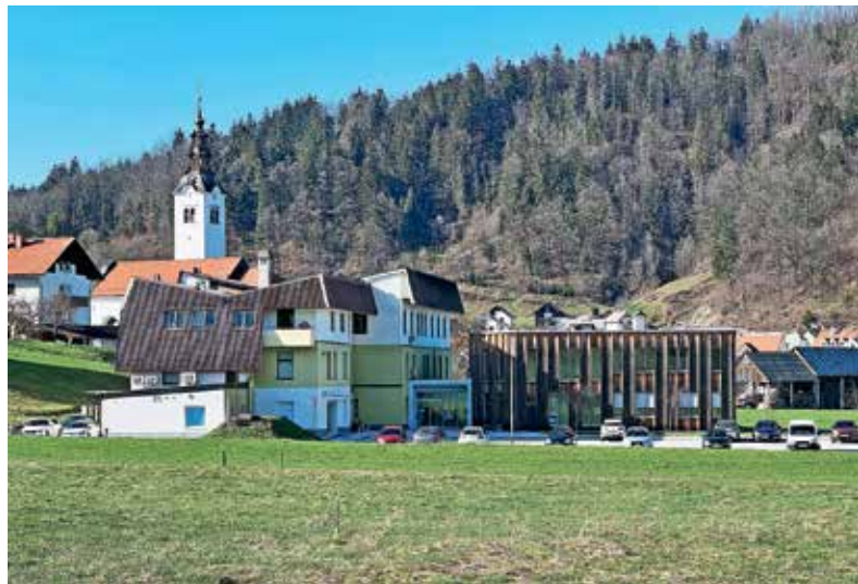
V Gorenji vasi jim je uspelo razviti sodoben zdravstveni center vrhunskih strokovnjakov.

Poleg tega spodbujajo vrsto drugih dejavnosti: podpirajo delovanje krajevne enote Rdečega križa, preventivne programe CSD Škofja Loka, kot so socialno vključevanje posebej ranljivih skupin, programe Sožitja (društva za pomoč osebam z motnjami v razvoju), sofinancirajo zdravstveno letovanje otrok na Debelem rtiču, programe na področju socialno-humanitarnih dejavnosti, programa pomoč na domu in družinski pomočnik ter izvajajo prostovoljski projekt Prostofer. Ker zdravje sodi med najpomembnejše prvine kakovosti življenja v nekem okolju, pa so na občini ponosni tudi na prizadevanja obeh osnovnih šol za športno udejstvovanje in skrb za boljše zdravje in počutje otrok in mladostnikov.