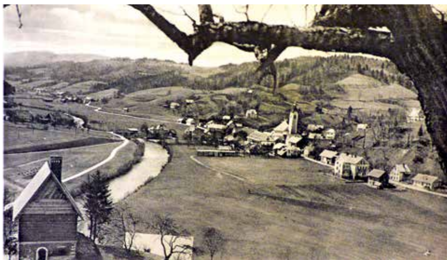
Poljane v poznih 30. letih 20. stoletja na razglednici

Razglednice so v dobi, ko še ni bilo elektronskih medijev, pomenile pomemben korak v napredku komunikacije. Z njimi so naslovniku poslali poleg pisnega tudi vizualno sporočilo. Razglednice s fotografijo domačega kraja so lajšale domotožje osebam, ki so se preselile daleč od doma. Tudi Poljane so že zgodaj dobile svoje razglednice. Običajno je bila v kakovostni fotografski tehniki posneta panorama naselja, ki ga je do leta 1954 označevala markantna stavba cerkve sv. Martina in gruča hiš starega vaškega jedra okrog nje