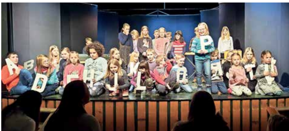
Abeceda učencev Podružnične šole Sovodenj

Slovenski kulturni praznik smo Sovodenjčani ponovno lahko praznovali sproščeno, družno in ponosno v dvorani. Spet so oživele aktivnosti različnih kulturnih skupin, ki so rezultate dela in truda ponudile kar številnemu občinstvu v dvorani. Zapel je mešani cerkveni pevski zbor in pevke Grabljice. Dva venčka je zaplesala folklorna skupina turističnega društva, ki se intenzivno pripravlja na plesno gostovanje v Ameriki. Z rimanimi besedami so se spoprijeli član kulturnega društva in učenci podružnične šole. Slednji so zatrdili, da »z abecedo našo ves svet se nam naslika, da med tabo in mano, med nami, med vami je tisoč besed in zato nismo sami«. Tudi ritem jih je peljal po zvočnih poteh, saj so abecedne deklamacije z zvoki obogatili še učenci pevci in zvočna Orffova kulisa. Ves program so dopolnjevale in povezovala skrbno izbrane ter v poduk podane besede in misli o delu pesnika Prešerna v izvedbi Štefke Eržen.