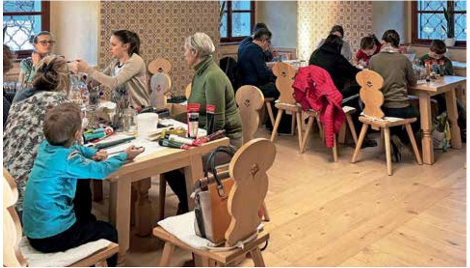
Delavnica izdelave nakita