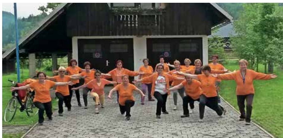
Jutranja vadba 1000 gibov

Organizatorji so dosegljivi na elektronskem naslovu info@solazdravja.si ali po telefonu 059 932 066. Če se vas bo zbralo dovolj, bodo organizirali poskusne vadb v vašem kraju in tako spodbudili vaše lokalno okolje k rekreaciji, ki postaja vse bolj priljubljena med starejšimi. Vadi namreč že več kot štiri tisoč članov društva na več kot 250 lokacijah po Sloveniji. Jutranja vadba 1000 gibov poteka na prostem, v parkih, na zelenicah in igriščih. Vsako jutro ob 7.30 ali 8. uri zjutraj se vadeči zberejo na 30-minutni vadbi, sestavljeni iz stoječih vaj, s katerimi lahko razgibate in ogrejete celo telo, od dlani do stopal. Vadba je primerna za vse generacije, vsak si jo prilagodi glede na svoje zmožnosti. Vse, kar potrebujete, so udobna oblačila in športni copati. Društvo šola zdravja je humanitarna organizacija, ki skrbi za promocijo gibanja